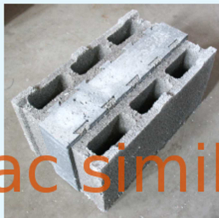
Fotografia del campione.

Nota: le dimensioni nominali sono indicate nell'ordine lunghezza x larghezza x altezza, come prescritto dalla norma UNI EN 771-3:2011 "Dimensions", conseguentemente la seconda dimensione riportata è lo spessore della muratura priva di intonaco.